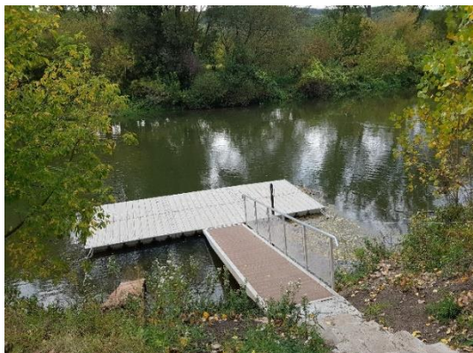
Mólo v Ipolydamásd-e