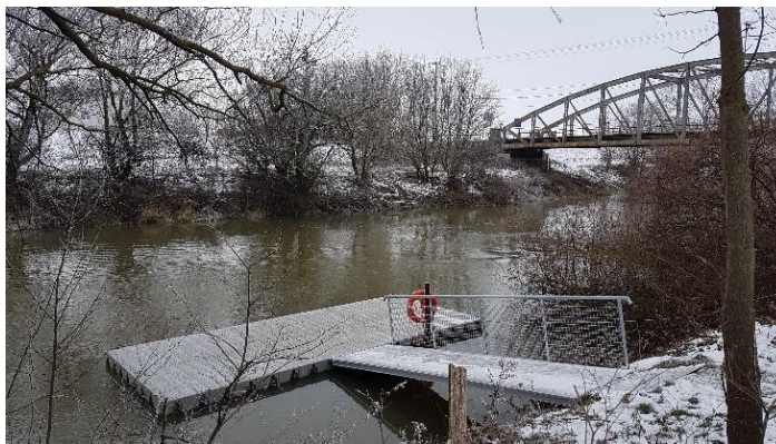
Mólo v Letkés-i

Zoskupenie je oprávnené využívať vodnú plochu na základe Zmluvy o prenájme vodnej plochy uzavretej s riaditeľstvom vodnej správy (nájomné je 50 tisíc forintov ročne/mólo). Prevádzka a údržba mól sa vykonáva v spolupráci so samosprávami.